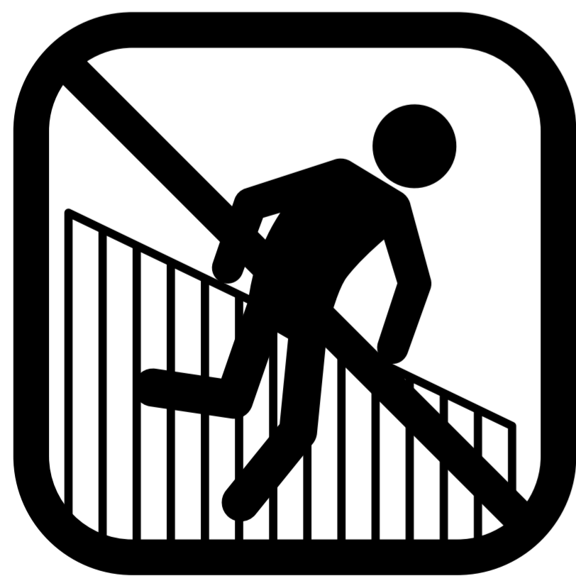
Forcering af hegn

Betaling af ovennævnte afgifter udelukker ikke anvendelse af øvrige sanktioner og retsforfølgelse.